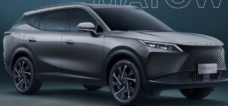
MATTE GRAY (UK)