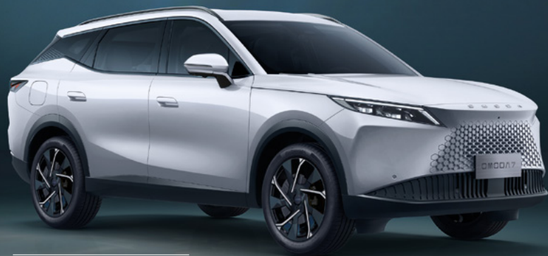
KHAKI WHITE (BW)